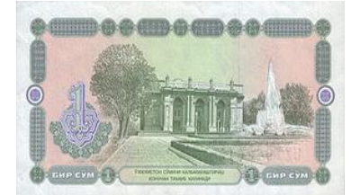
紙幣に描かれている日本人が建設に関わったナヴォイ劇場

「海外引揚がつないだご縁」を東京オリンピック・パラリンピックにつなげようと「ホストタウン」に登録されました。