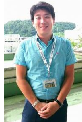
レ アルトウルさん ウズベキスタンからの国際交流員として1年間、舞鶴市で勤務されます。